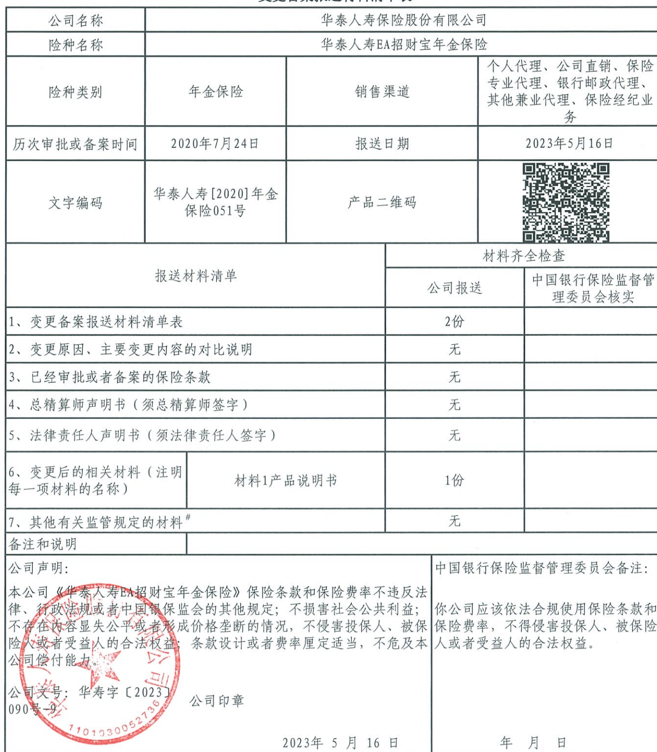
变更备案报送材料清单表